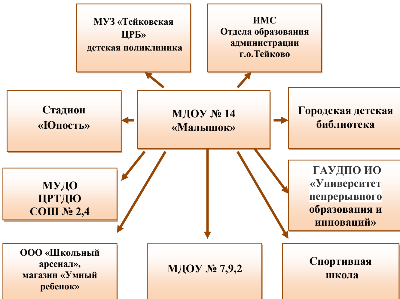
Схема взаимодействия МДОУ с социумом

В настоящее время педагоги стремятся проанализировать накопленный опыт и адаптируют его к современным условиям, дополняя новым содержанием. Педагогами разработана определенная дидактическая последовательность ознакомления дошкольников с социумом ближайшего окружения, которая успешно осуществляется на практике.